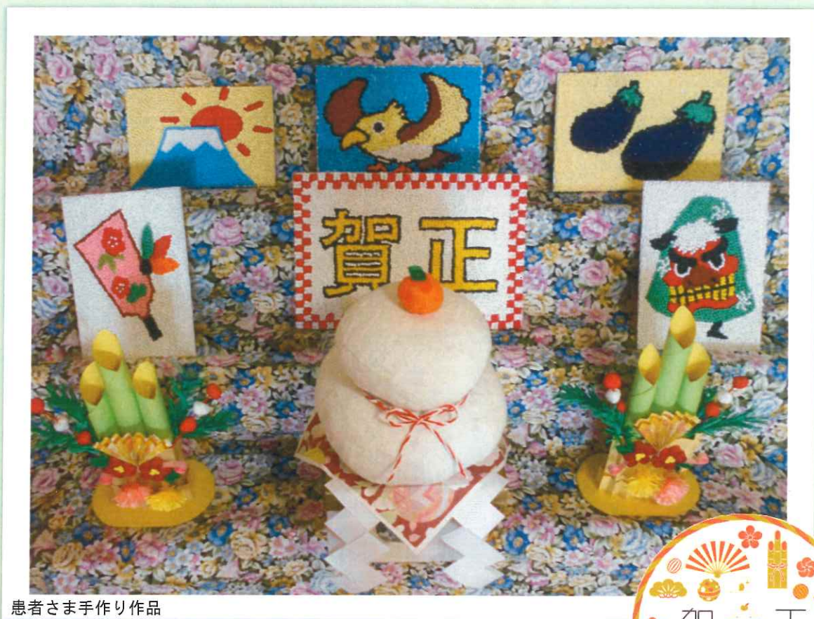
患者さま手作り作品